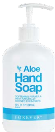
Aloe Hand Soap Алое сапун за ръце

Нов и усъвършенстван, алое сапунът за ръце успокоява при всяко измиване. Създадена с чист 100% стабилизирани гел от алое вера и натурални овлажняващи съставки, формулата без парабени и с нежни плодови екстракти омекотява и хидратира кожата.