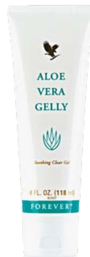
Aloe Vera Gelly Алое вера гел

Алое вера въздейства благотворно на кожата по безброй начини, а нашият алое вера гел е толкова чист и силен, сякаш току-що сте го изстискали от листата на вълшебното растение. Плътният, прозрачен гел попива бързо в кожата и я овлажнява, успокоява и защитава. Не цапа дрехите и е чудесен за облекчаване на леки кожни раздразнения.