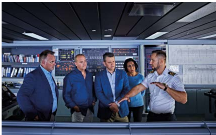
Грег Моън Президент на Форевър Ливинг Продъктс